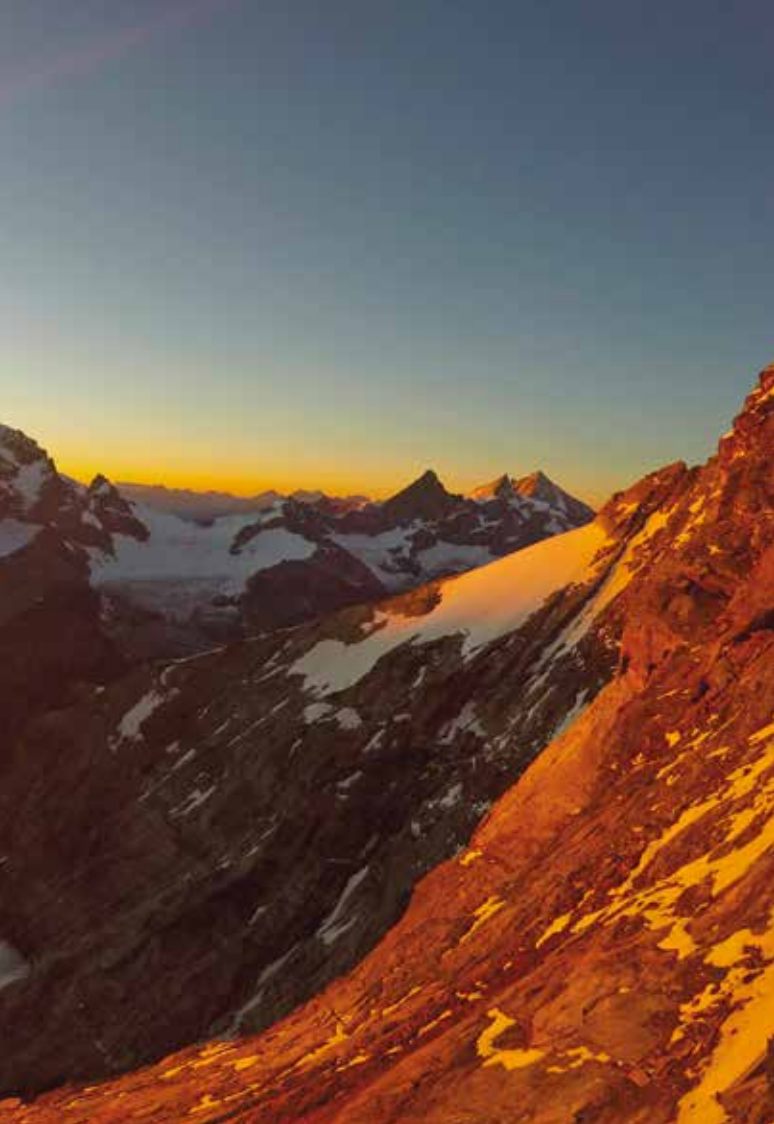
Tramonto da Capanna Carrel

arrivati fin lì lo era altrettanto. Non c'era tempo tuttavia per crogiolarsi, bisognava pensare solo a superare quella infinita traversata che ci aspettava e che ci guardava con occhi di sfida; era giunto il momento di dimostrare di che pasta fossimo fatti. Continuummo ad alternarci al comando superando diversi ripidi pinnacoli; gestii